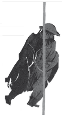
Im ersten Schritt heißt das ganze Weg